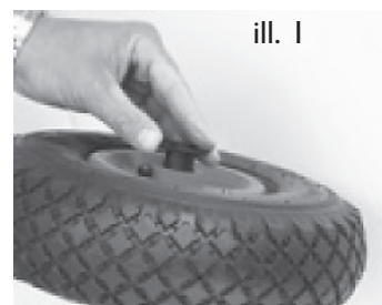
Illustration 1 og 2.

Ukrudtsbrænderen er kun til udendørs brug og bør ikke bruges i nærheden af brændbart materiale. Under brug bliver brænderrør meget varmt, undgå derfor at røre ved brænderrør før og efter brug. Efter brug bør ukrudtsbrænder placeres et sted til afkøling, hvor den ikke kan antænde noget.